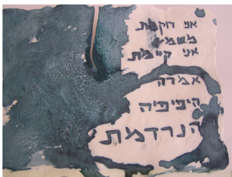
אני רוקמת פורצלן, 23X22

תערוכה זו חוקרת, עוקבת אחר קו התפר שבין חיים, חפצים, אומנות ומקום. הזיכרון החפצי הופך למוליך ביצירת האומנות.