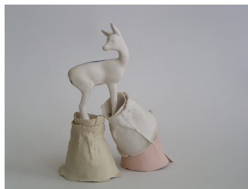
אילה אשלח פורצלן, 10X8