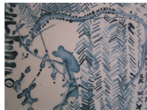
אריח ציור על פורצלן, פרט

• התמונות וקורות חיים מצורפים לדיסק בקבצים נפרדים