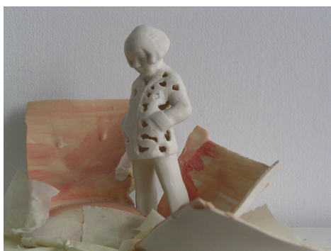
ילד / ילדה פורצלן, פרט ממיצב