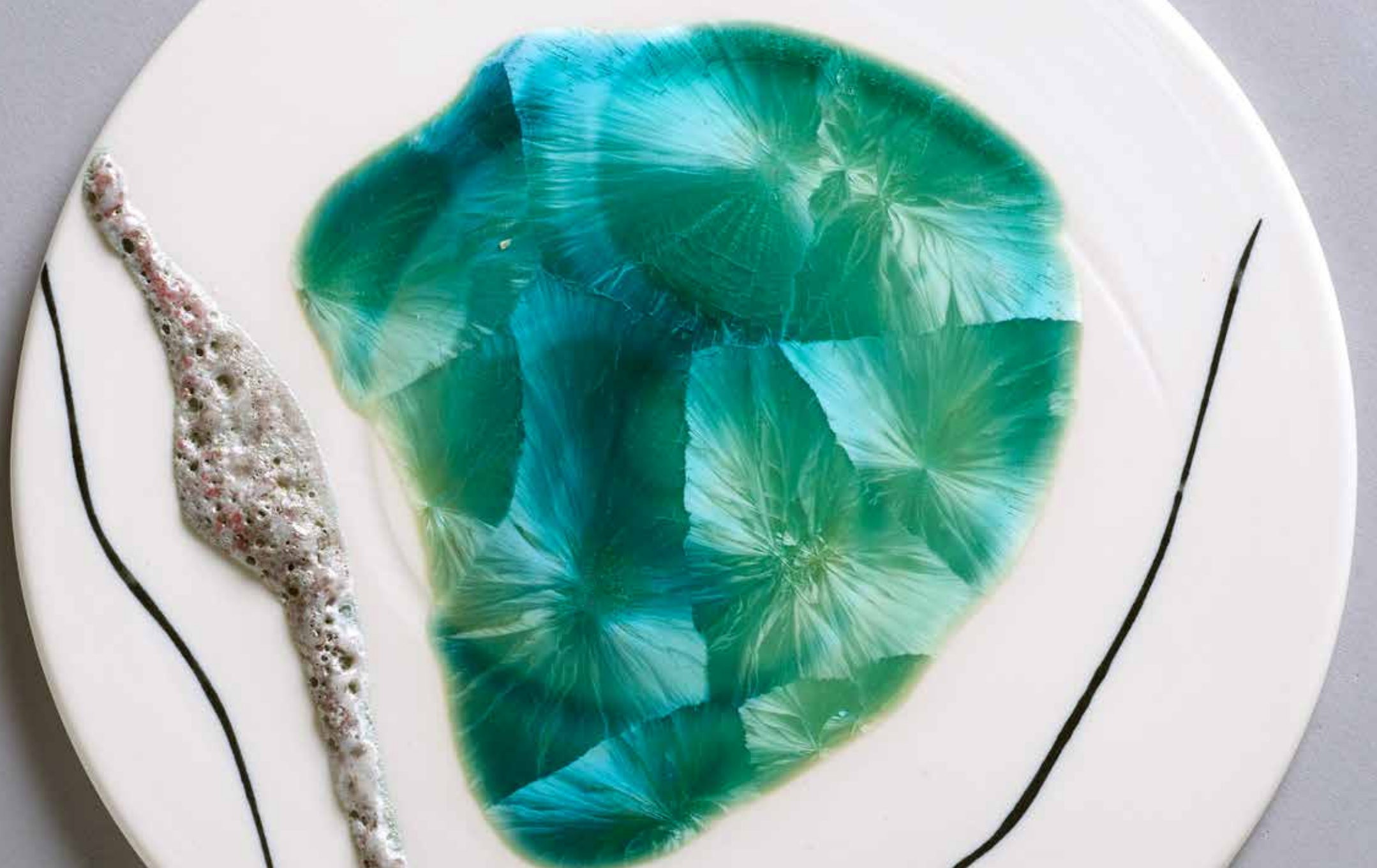
סעודה תלויה. פורצלן, אובניים, זיגונים וולקניים וקריסטליים, שריפה לקון 10, 600x24 ס"מ (בכפולה הבאה)