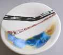
Landscape Banquet / Shulamit Teiblum-Millar