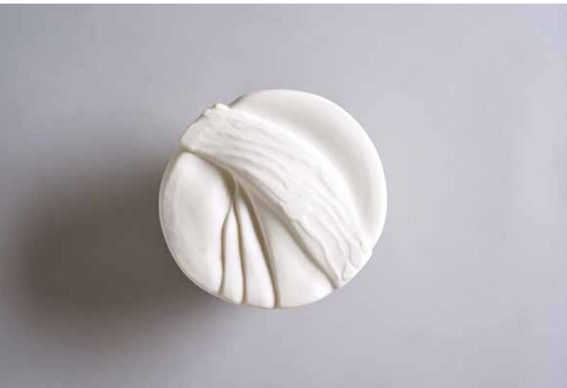
סעודה לבנה. פורצלן, עבודת אובניים, קון 10, 150x150 ס"מ (בכפולה הקודמת)