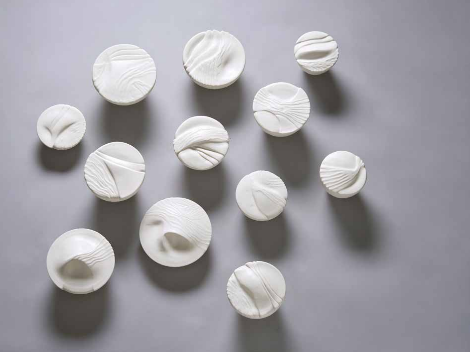
Landscape banquet. Porcelain, thrown and altered. Con 10. Con 10, 150x150 cm (next spread)