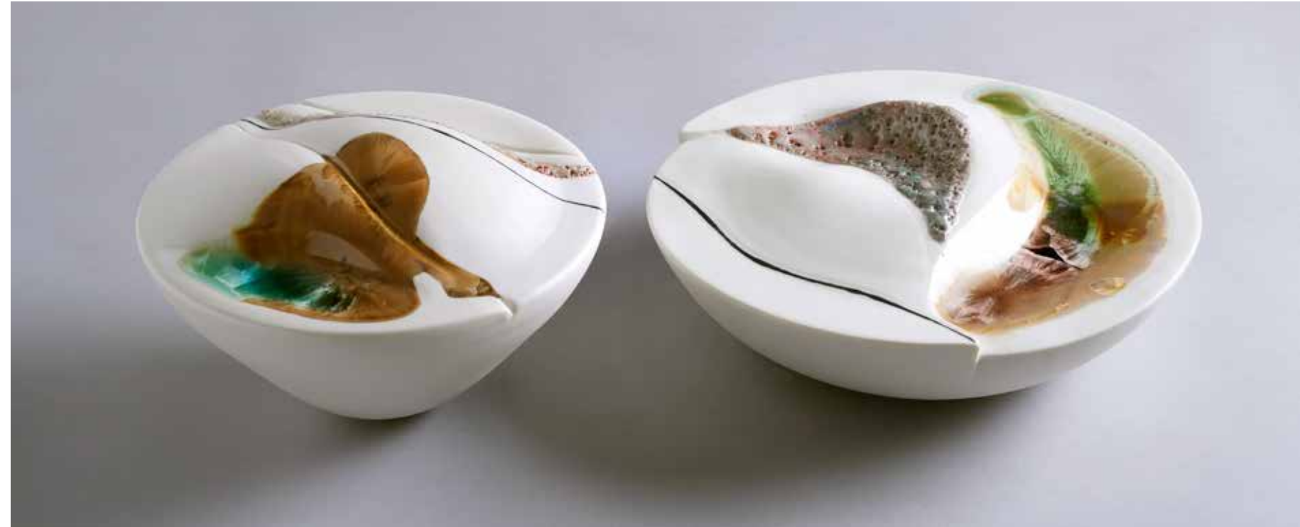
Landscape banquet. Porcelain, thrown and altered, crystalline and volcanic glazes. Con 10, 550x180 cm (next spread)