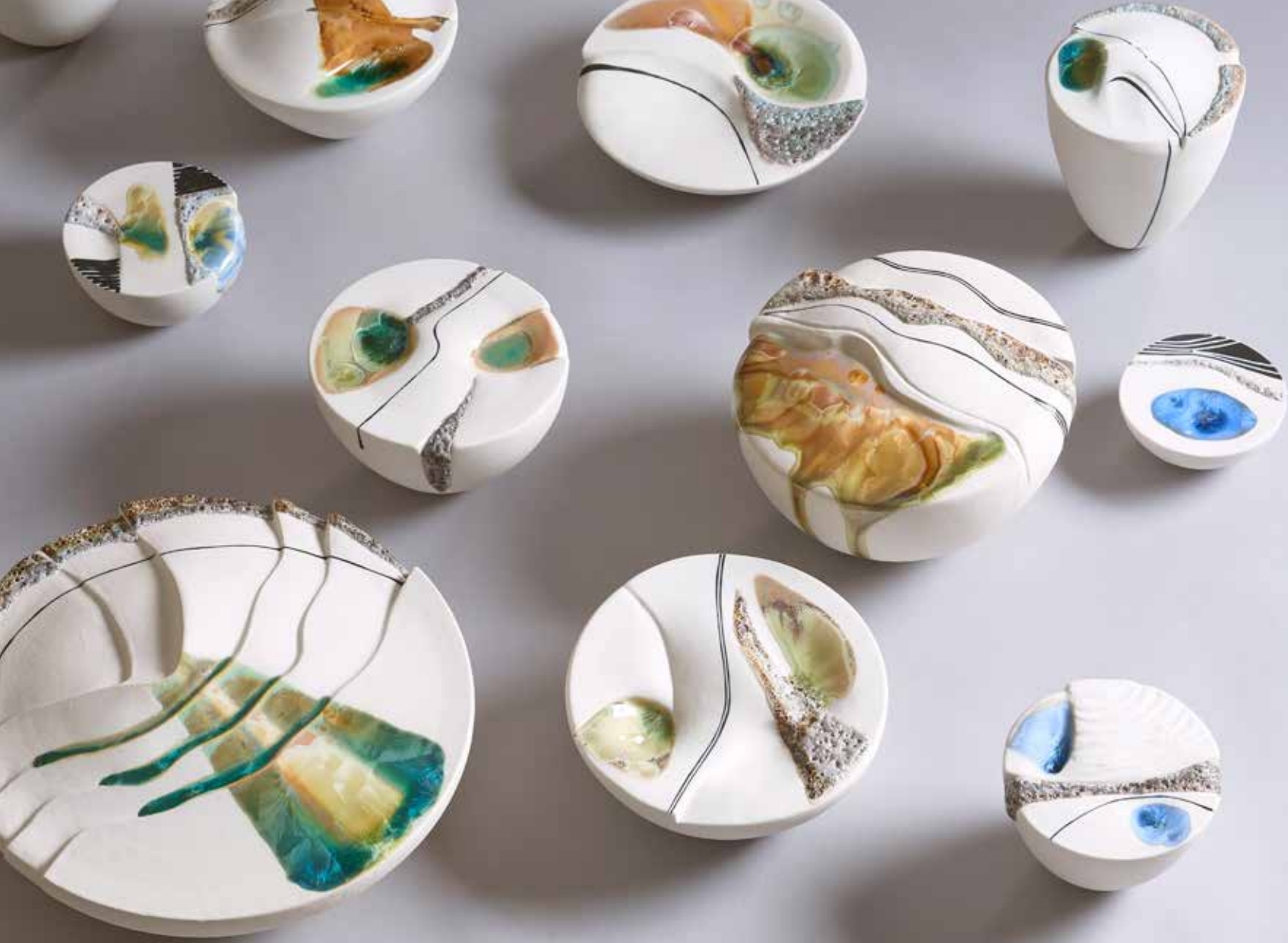
סעודת נוף / שולמית טייבלום-מילר