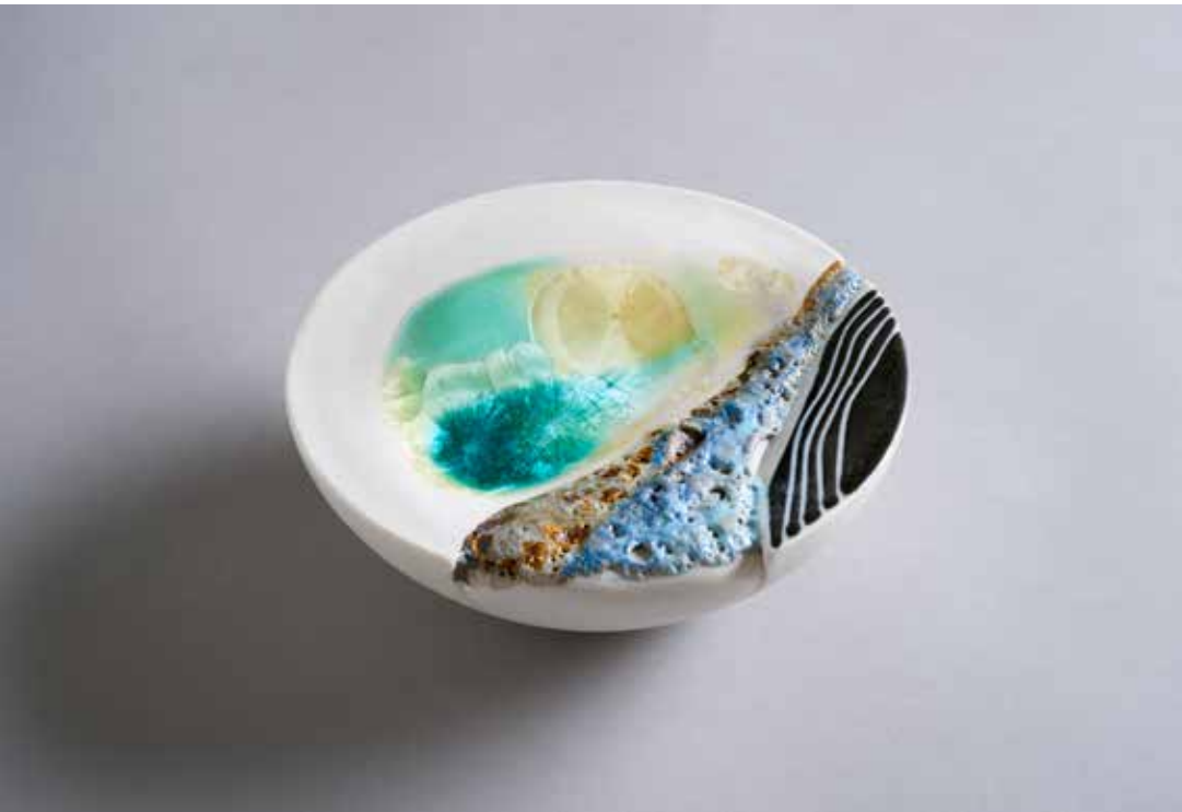
סעודת נוף. פורצלן, אובניים, זיגונים וולקניים וקריסטליים, שריפה לקון 10, 550x180 ס"מ (בכפולה הקודמת)